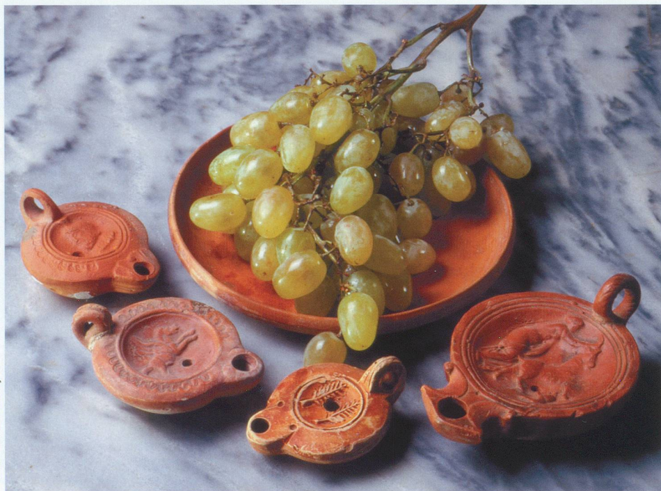
Musée romain de Nyon

Les Gallo-Romains s'offraient des lampes en cadeau.