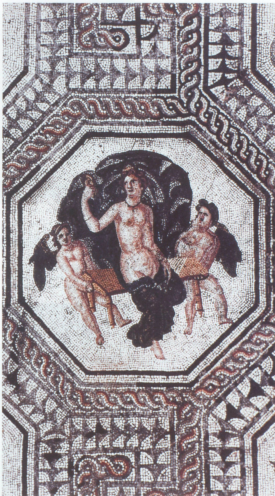
La Vénus d'Orbe, un chef-d'œuvre d'artistes romains confirmés.

Outre les thermes et toutes les installations de confort de la maison, l'établissement agricole comportait une partie plus modeste où étaient logés les ouvriers. Plus de quinze ans de fouilles n'ont pas encore exploré l'ensemble de l'exploitation. Une surprise attendait les archéologues au cours de leurs travaux. La présence d'un temple, consacré au dieu