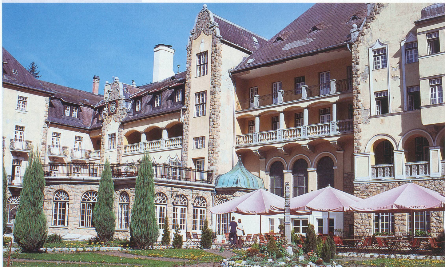
Restaurés ou non, les bâtiments doivent être d'époque.

Mis en place par les gouvernements portugais et espagnol dans le but de financer à moindres frais la restauration de bâtiments