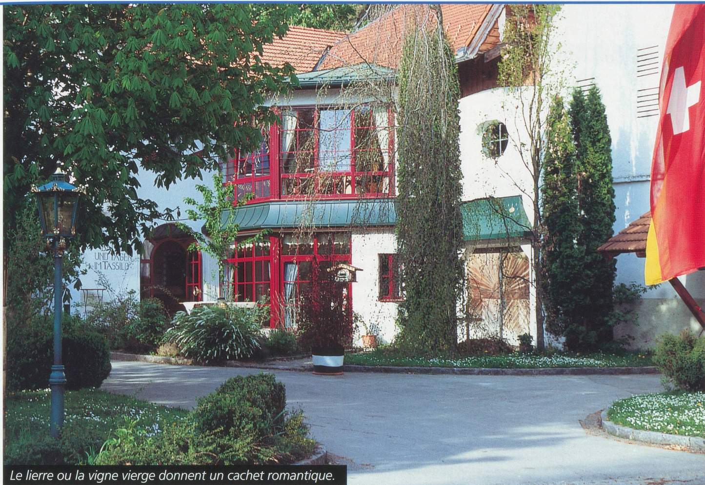
Le lierre ou la vigne vierge donnent un cachet romantique.