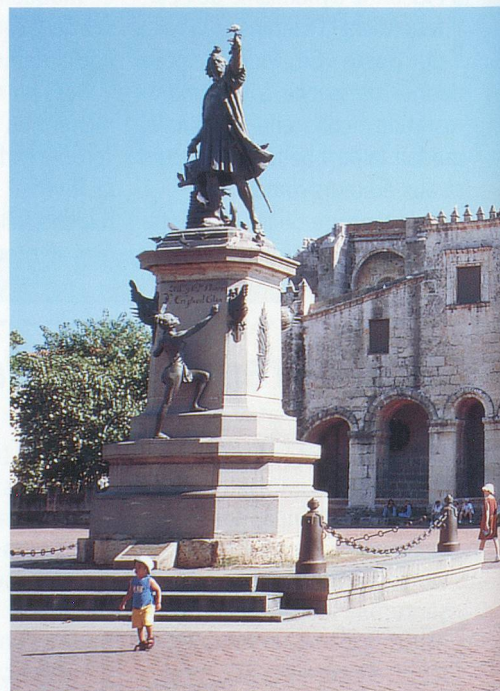
La statue de Christophe Colomb sur la place

La vie semble se dérouler au ralenti, comme dans la plupart des îles des Caraïbes. Jusque dans les endroits les plus reculés, les indigènes sont souriants, accueillants, toujours prêts à rendre service ou à offrir le peu qu'ils ont. Dans une île qui a connu une histoire pour le moins mouvementée, on distin-