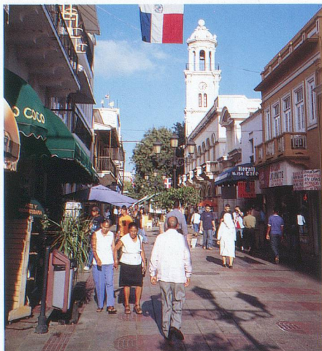
La rue principale de la capitale.