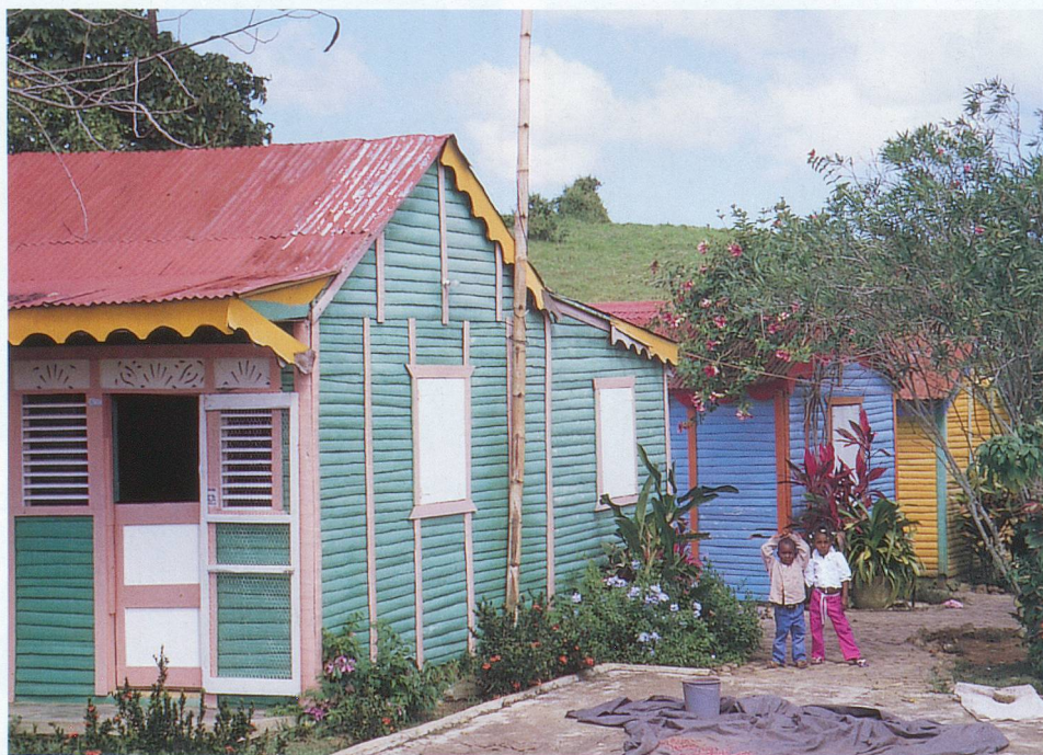
Des maisons colorées traditionnelles sur la route de Higüey.