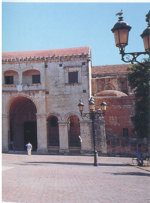
la Cathédrale à Santo Domingo.