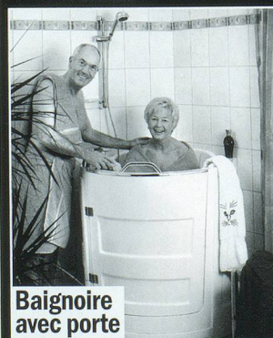
Baignoire avec porte

à partir de Fr. 5900,- pour monte-escaliers droits à partir de Fr. 11900,- pour monte-escaliers tournants