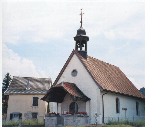
▲ La chapelle de Pringy.

Difficile de traverser la petite bourgade sans ignorer l'immense Maison du Gruyère, qui voit défiler chaque année plus de 100 000