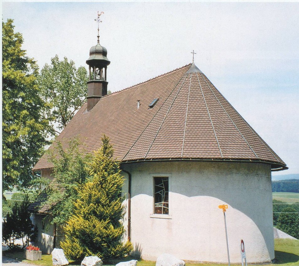
La chapelle des Marches, le petit « Lourdes » fribourgeois.