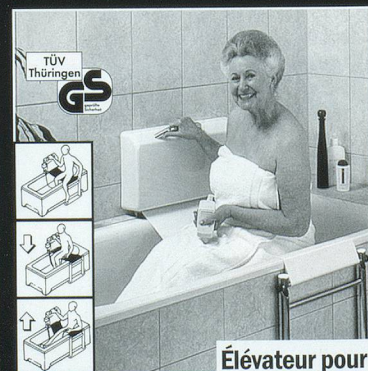
Élévateur pour baignoires

Kostenfrei Prospekt anfordern: 08 00-55 66 44