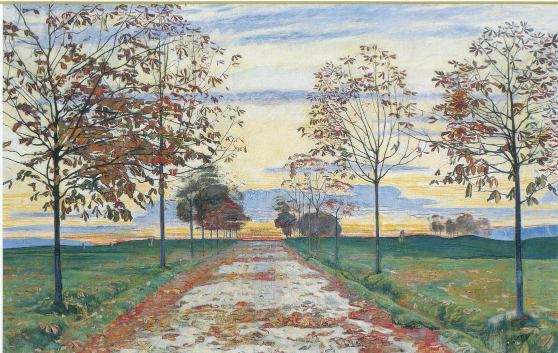
Soir d'Automne, 1892, huile et tempera sur toile.

■ Ferdinand Hodler (1853-1913) est à l'honneur au Musée Rath de Genève jusqu'au 1 er février 2004. Quelque 90 paysages de l'artiste suisse y sont présentés.