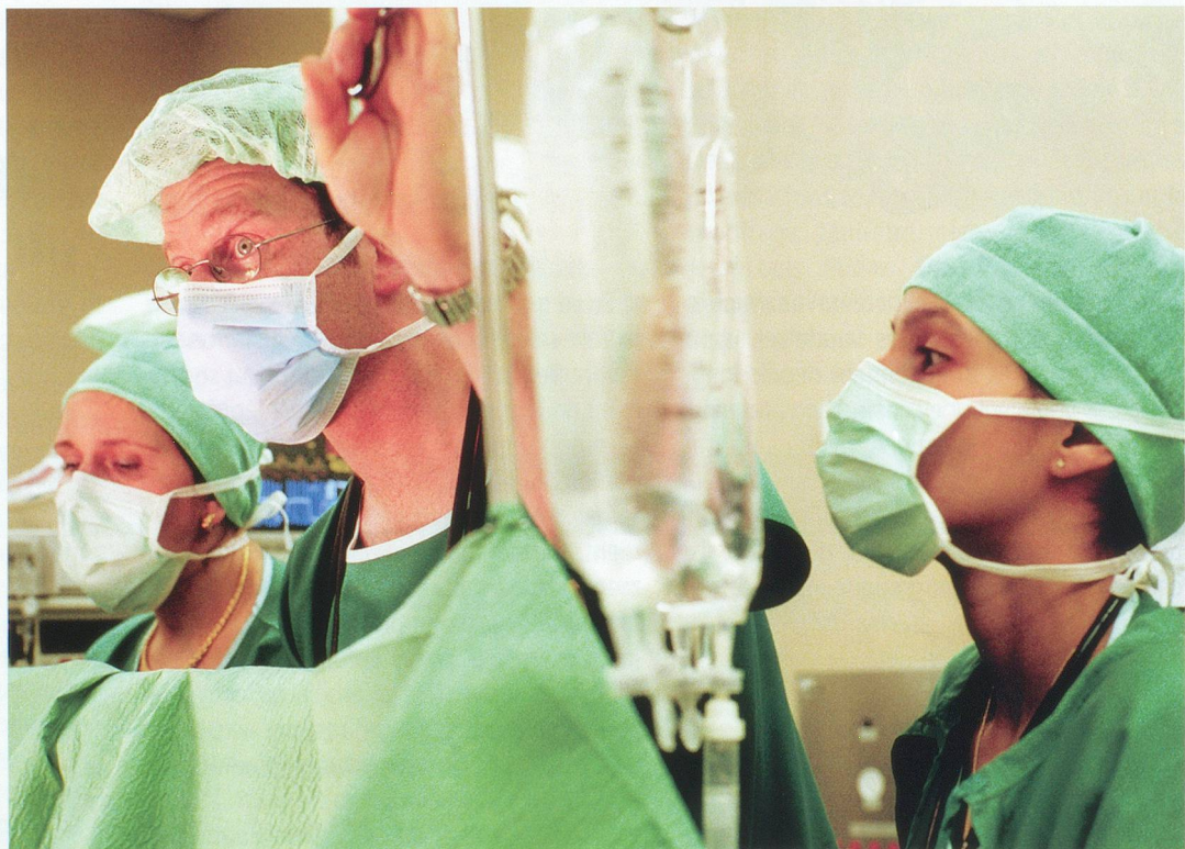
Sur une carte à puce, tous les actes médicaux concernant le patient seront répertoriés.

Dans un premier temps, l'affiliation au réseau de santé sera facultative, tant pour les médecins que pour les patients. «Pour les médecins, cette mise en réseau permettra un véritable échange d'informations, et par conséquent une