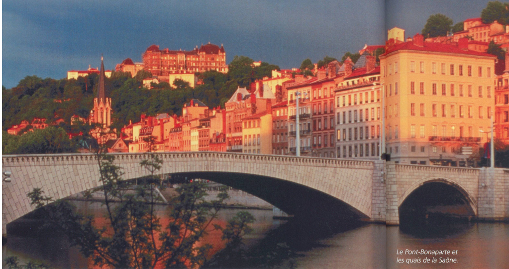
Le Pont-Bonaparte et les quais de la Saône.

échappé de peu à la démolition. Il a fallu l'intervention d'André Malraux, alors ministre de la Culture de De Gaulle, pour sauver ce patrimoine. Depuis lors, il est en constante restauration.