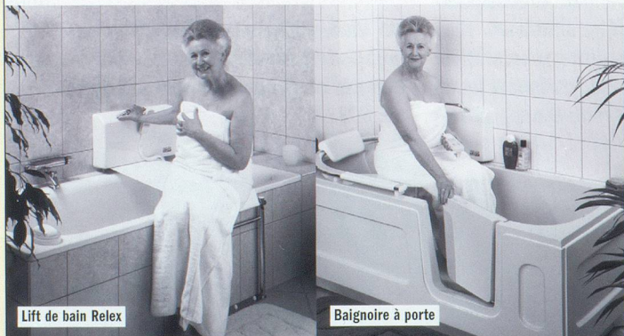
Lift de bain Relex