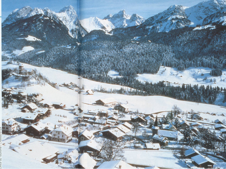
Office du Tourisme / Château-d'Ex

»» Caves de L'Etivaz , tél. 026 924 62 81. Depuis Les Moulins, emprunter la route de col des Mosses, les caves se trouvent sur la droite en montant au milieu du hameau de L'Etivaz.