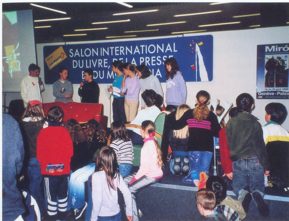
Remise du Prix Chronos – Pro Senectute 2002.

attirés par cette thématique. Il arrive aussi que certains ouvrages rallient les suffrages des deux jurys; c'est ainsi que, cette année, le roman de Xavier-Laurent Petit, publié en 2002 chez Flammarion, cumule les prix décernés par les juniors et les seniors.