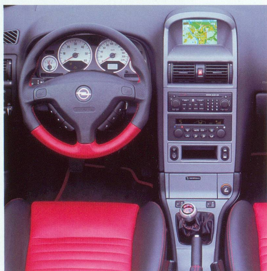
Des autoradios très convoités.

Contrairement à une idée reçue, ce ne sont pas les maisons qui sont le plus souvent cambriolées mais bien les appartements. Les propriétaires de villas n'hésitent en effet pas à s'équiper d'alarmes et à renforcer portes et fenêtres. Les locataires, amenés à déménager plusieurs fois dans une vie, renoncent souvent à prendre à leur charge des travaux qui leur assureraient pourtant plus de sécurité. On peut d'ailleurs s'étonner qu'aucune législation n'oblige les propriétaires d'immeuble à des équipements de base comme, par exemple, des portes d'entrée solides. Les normes anti-