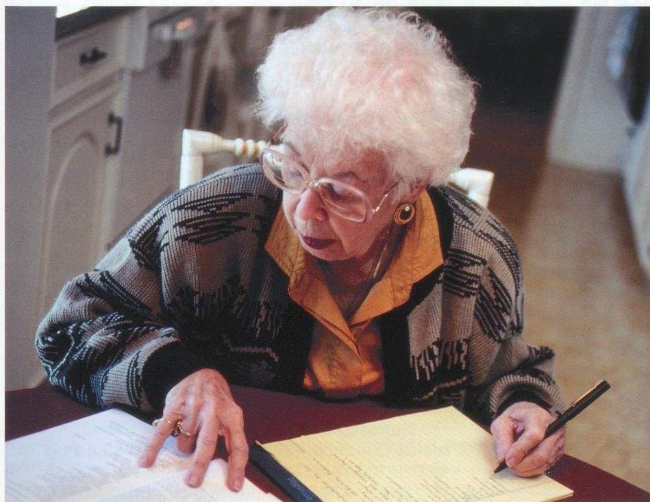
Certains cours exigent parfois d'être bûchés à la maison...