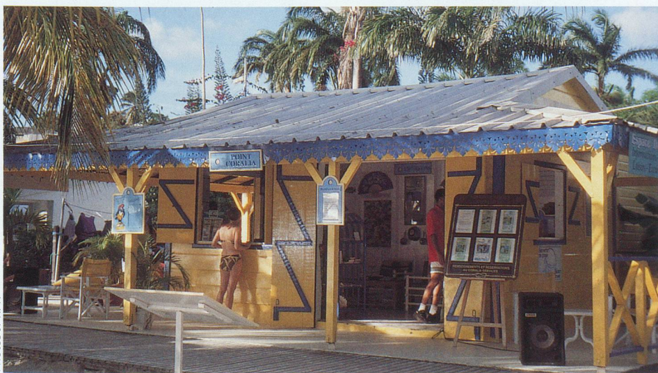
Soleil, plages et activités diverses à la Guadeloupe.

Carlson Wagonlit Travel, gare CFF, 1001 Lausanne. Tél. 021 320 72 35.