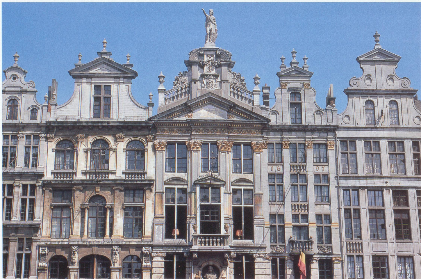
Les maisons de la Grand-Place de Bruxelles présentent des façades à l'architecture somptueuse.