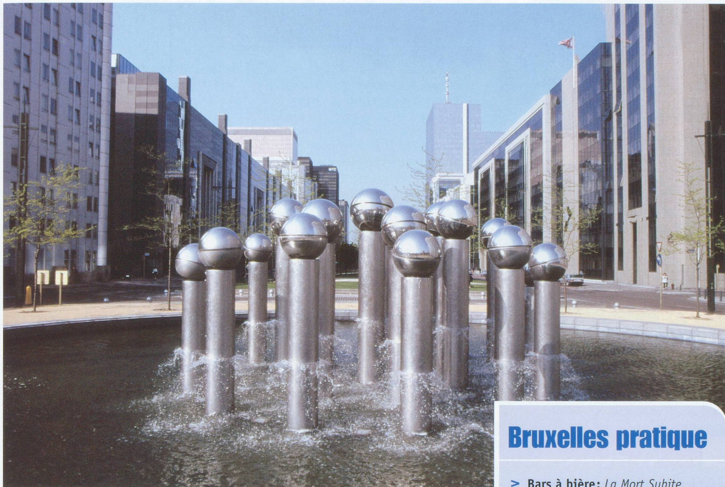
L'Esplanade Nord, la partie moderne de la ville. Ci-dessous, Bruxelles de nuit.