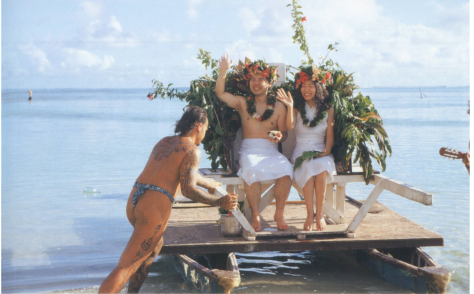
Mariage traditionnel à Moorea (Polynésie).