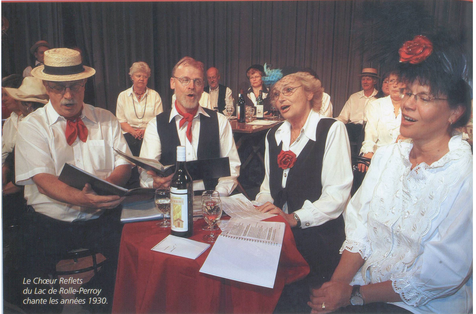
Le Chœur Reflets du Lac de Rolle-Perroy chante les années 1930.