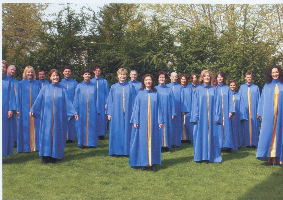
Génération-Gospel, le groupe valaisan vient de sortir un CD.