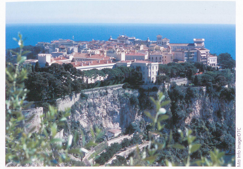
Le Rocher, avec le palais princier, est le centre historique de Monaco.