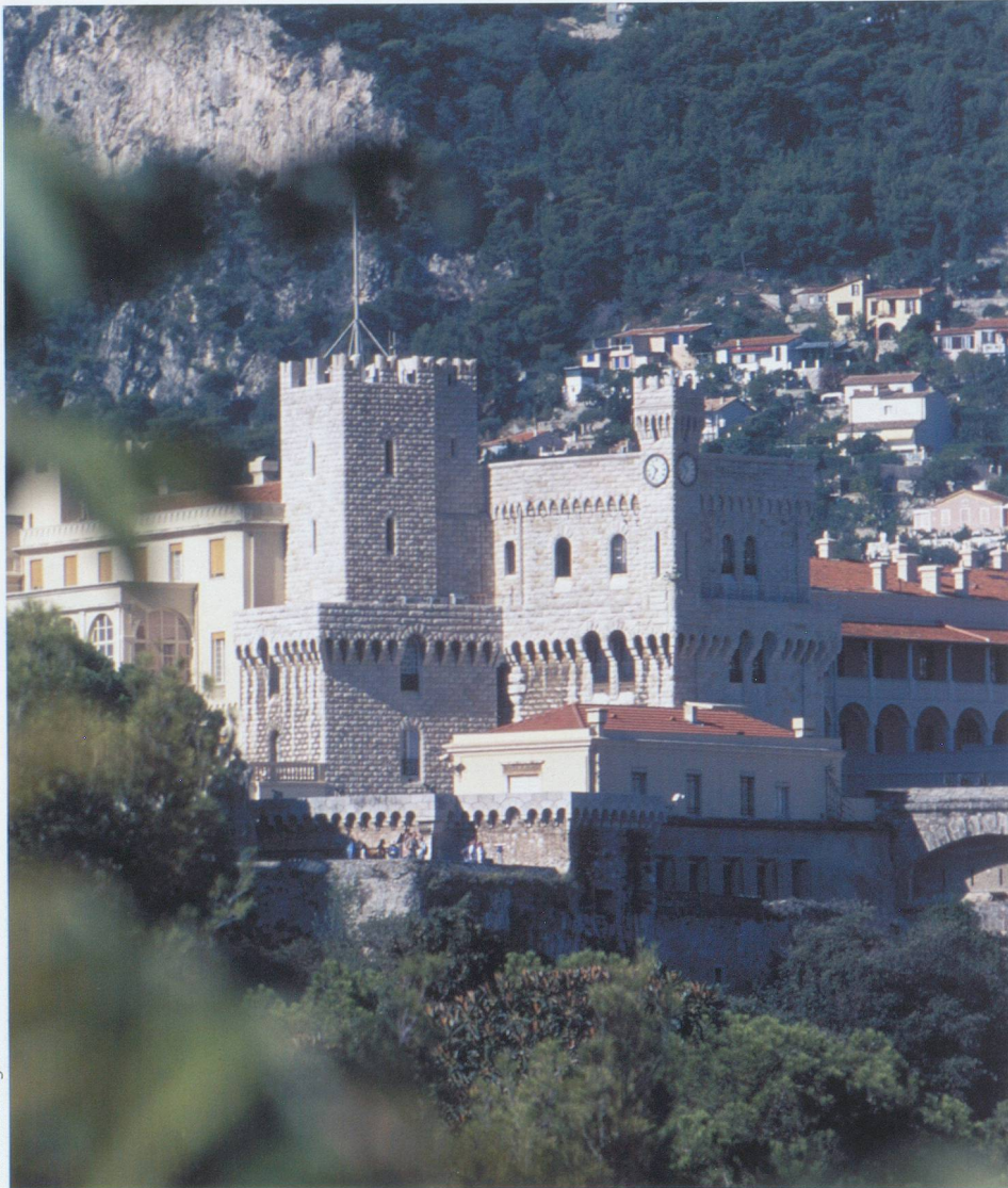
Miti Info Image

Le palais, qui abrite les appartements du prince, est aussi le siège du gouvernement.