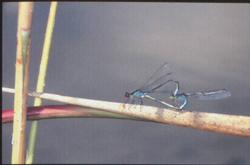
Une co-édition Musée Cantonal de Zoologie de Lausanne et Daniel Aubort Editions