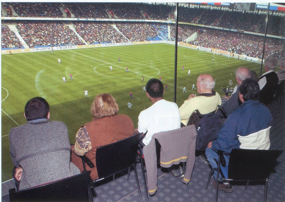
Au Tertianum de Bâle, les résidents peuvent suivre les matches en direct.