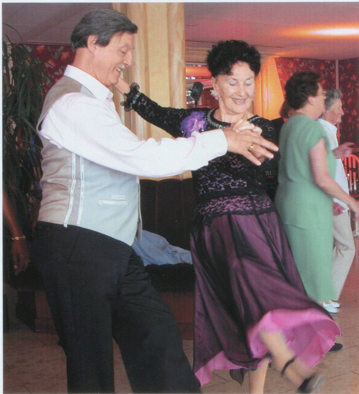
Les danseurs retrouvent leurs vingt ans.

Véritables phénomènes de société, les thés dansants se multiplient à travers nos régions. Il manque pourtant un élément essentiel afin que le bonheur soit total. Où trouver les cavaliers qui feront valser ces dames?