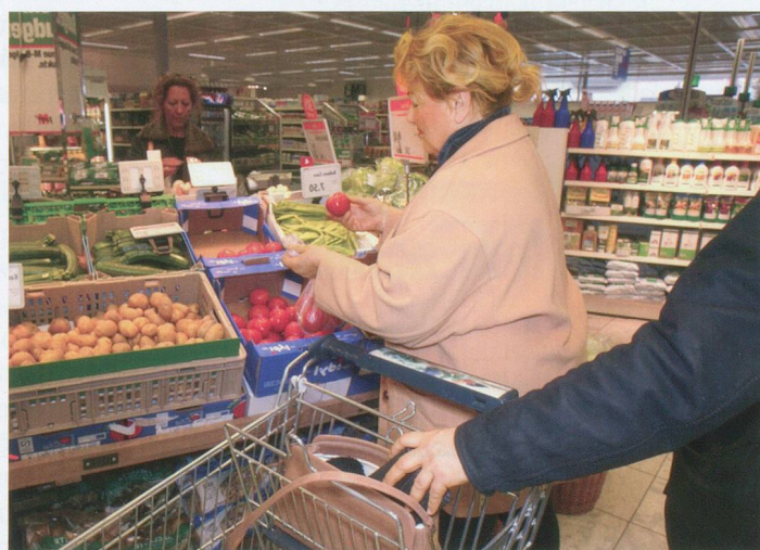
Prévention suisse de la criminalité, Neuchâtel