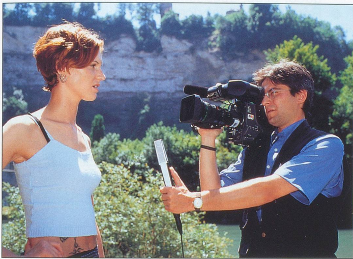
Nous sommes nés bien avant la télévision...

■ Ce texte nous a été envoyé par un lecteur de La Tour-de-Peilz. Il nous a semblé parfaitement adapté à notre époque épique.