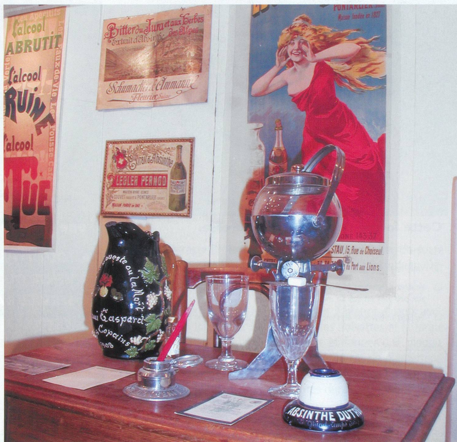
La fontaine à absinthe, un récipient indispensable à l'amateur de cet apéritif.

VVT Vapeur Val-de-Travers, 2123 Saint-Sulpice, tél. 032 861 34 98; www.vvt.ch ; Office du tourisme, Centre sportif régional, 2108 Couvet, tél: 032 889 68 96; www.vdt.ch et www.neuchatel-tourisme.ch