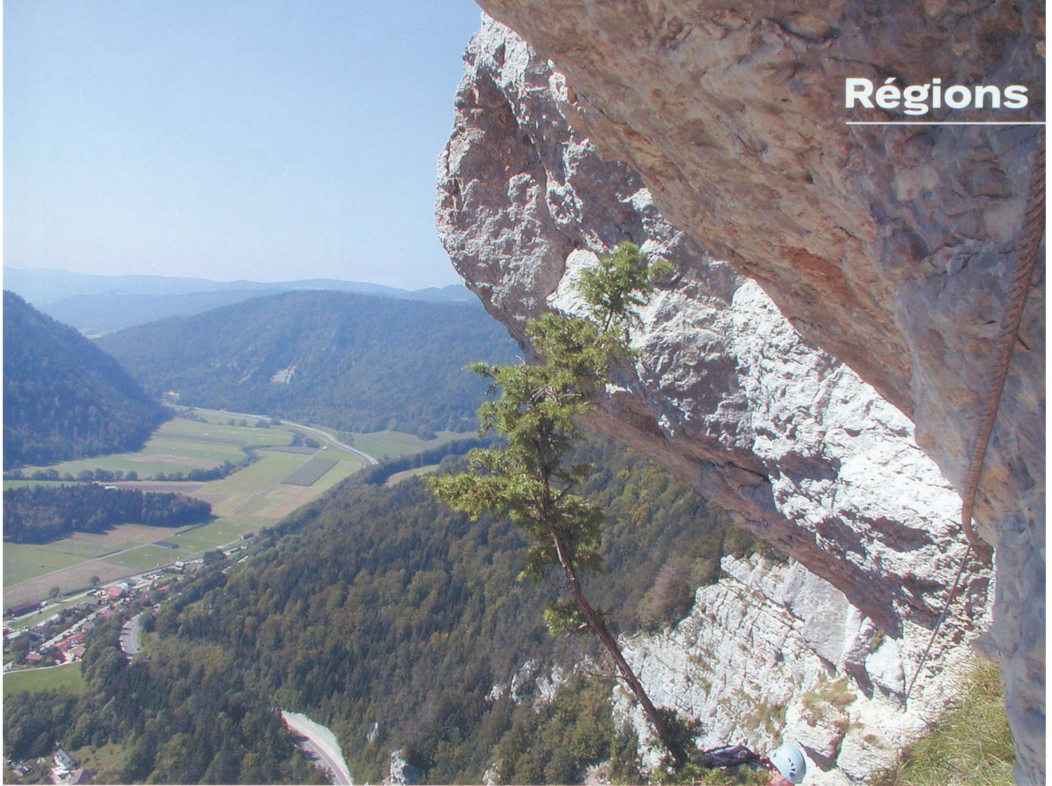
Le Val-de-Travers, une région méconnue qui mérite que l'on s'y arrête.