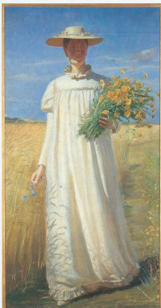
Michael Ancher, Anna Ancher revenant des champs , 1902

»» A voir: Impressions du Nord, la peinture scandinave 1800-1915 . Fondation de l'Hermitage, Lausanne, jusqu'au 22 mai. Du mardi au dimanche de 10 h à 18 h, jeudi 21 h. A lire: Sundborn ou les Jours de Lumière , Philippe Delerm, Folio.