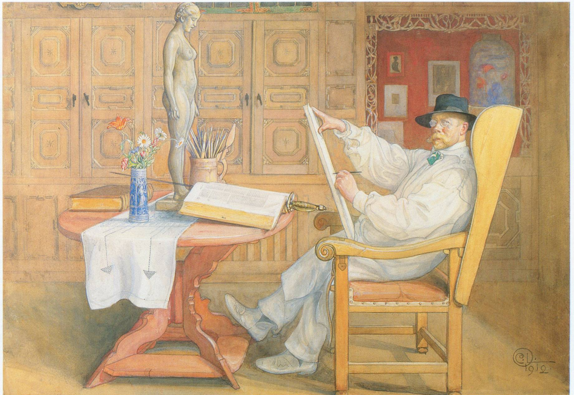
Carl Larsson , Autoportrait (dans le nouvel atelier) , 1912

La vision poétique de Delerm nous rend plus proches ces impressionnistes épris de lumière et de beauté. Leur recherche d'avant-garde, souvent mal compri-