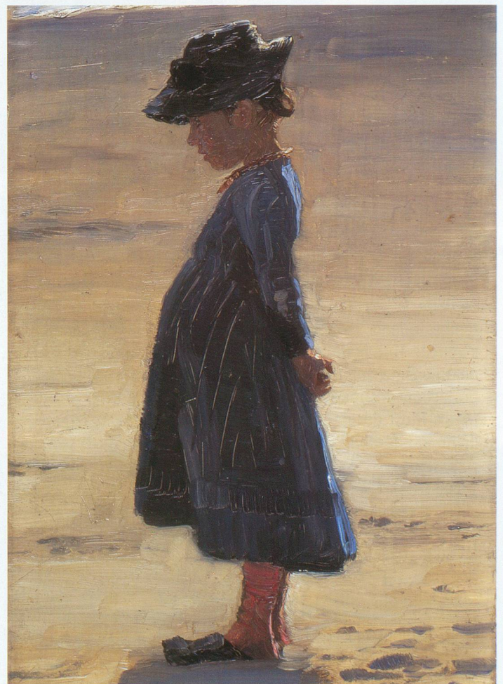
Peder Severin Krøyer , Petite fille debout sur la plage, au sud de Skagen , 1884