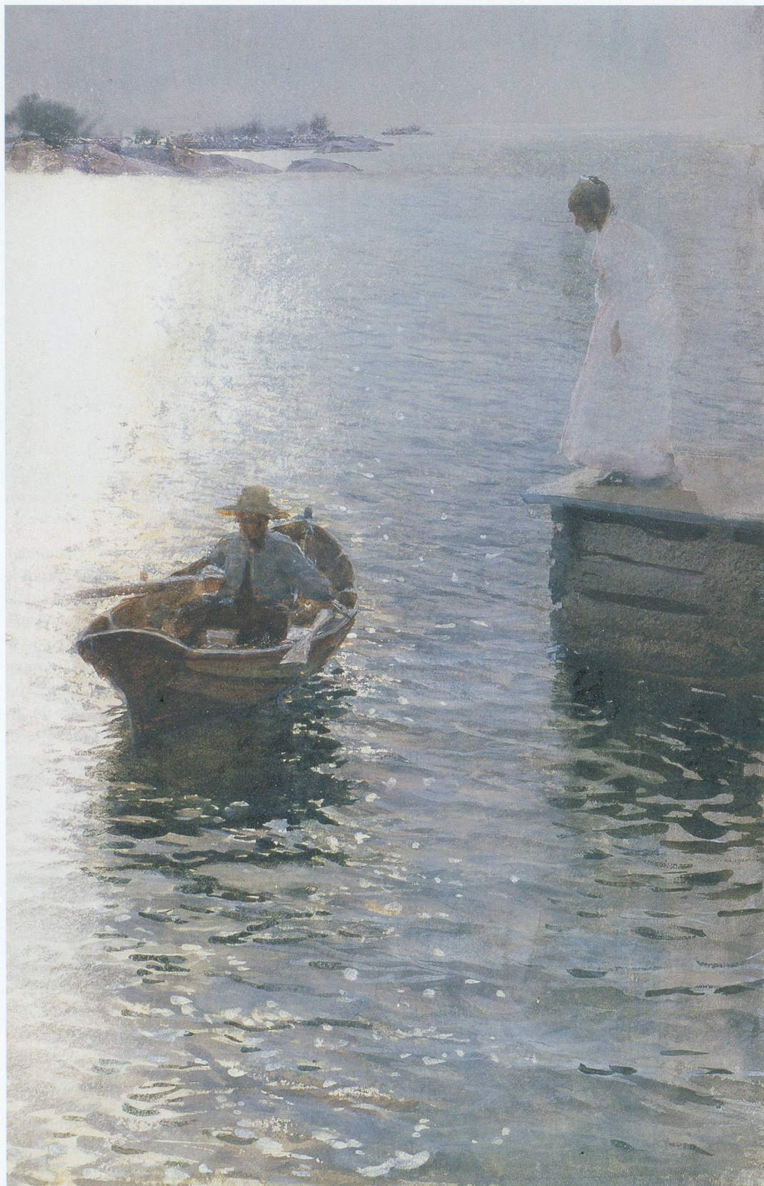
Anders Zorn, Vacances d'été, étude , 1886

Sur cette plage soudain pleine de vie, chacun saisit un sujet au vol, les femmes du groupe se promenant au bord de l'eau ou les habitants du lieu. L'un d'eux a, lui, choisi de peindre une petite fille, comme le raconte Delerm: «Krøyer avait d'abord ébauché une scène