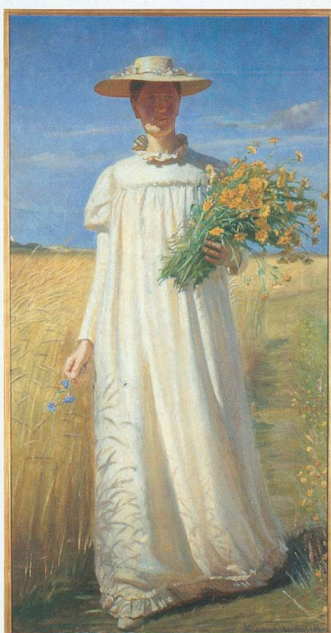
Michael Ancher , Anna Ancher revenant des champs , 1902

»» A voir: Impressions du Nord, la peinture scandinave 1800-1915 . Fondation de l'Hermitage, Lausanne, jusqu'au 22 mai. Du mardi au dimanche de 10 h à 18 h, jeudi 21 h. A lire: Sundborn ou les Jours de Lumière , Philippe Delerm, Folio.