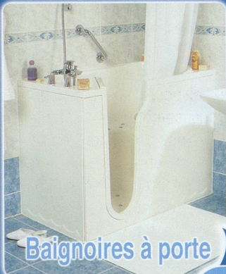
Baignoires à porte

saniva, en toute sécurité, en toute facilité !