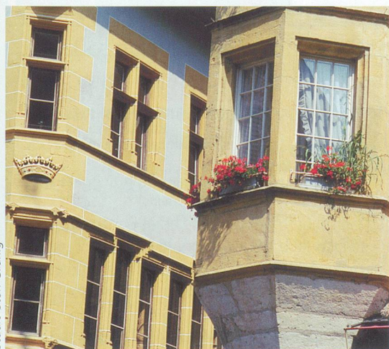
Une façade typique de la vieille ville.

• Les gorges du Taubenloch, magnifiques et sauvages, elles se trouvent à la sortie de Bienne côté Jura. Fermées durant quelques saisons pour cause de chutes de pierres, elles devraient être rouvertes ce printemps.