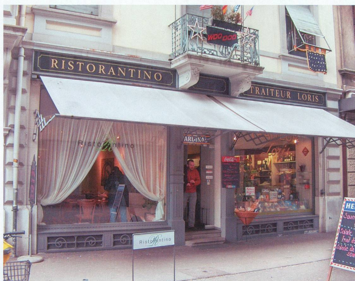
Al Ristorantino: on y sert de délicieuses pâtes italiennes.

Bienne a commencé à se développer considérablement dès la fin du 19 e siècle, avec la création du chemin de fer. L'industrialisation et surtout l'horlogerie l'ont