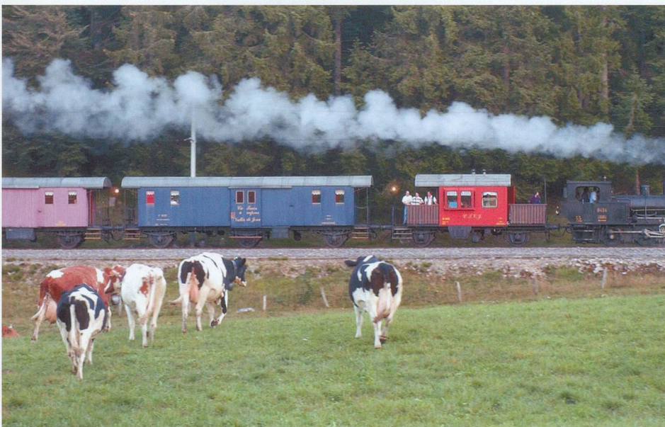
La vallée de Joux a remis la vapeur en circulation.

n'importe où et surprendre les contrebandiers en pleine action.