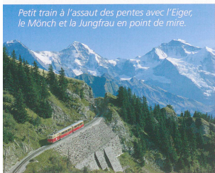
Petit train à l'assaut des pentes avec l'Eiger, le Mönch et la Jungfrau en point de mire.