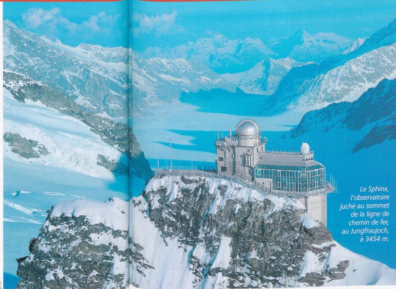
Le Sphinx, l'observatoire juché au sommet de la ligne de chemin de fer, au Jungfraujoch, à 3454 m.