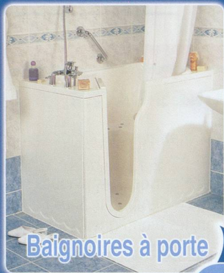
Baignoires à porte