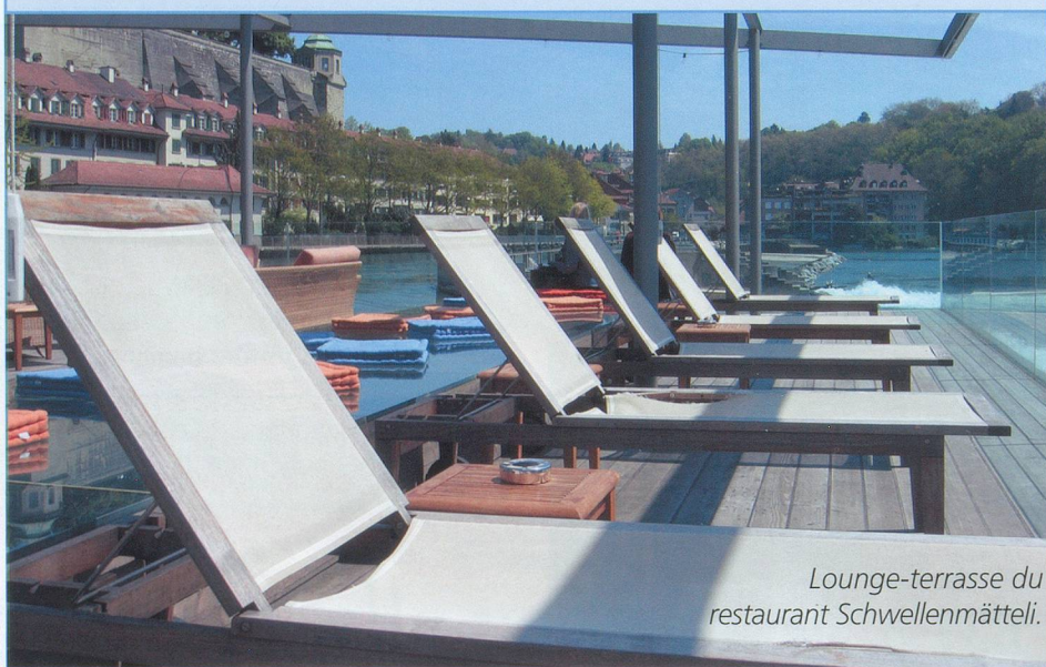
Lounge-terrasse du restaurant Schwellenmätteli.

Il suffit de passer le pont, celui du Kirchenfeld, et juste avant l'Helvetiaplatz, sur laquelle donne le château renfermant le Musée historique de Berne, on descend sur la gauche en direction du Schwellenmätteli. Un petit chemin, dans le bois, nous mène à ce restaurant bien connu des Bernois. En partie construit sur l'Aar, l'endroit refait à neuf, est conçu dans un style très contemporain. Sur la terrasse en teck, le bar se partage en lounge et coin-repos avec chaises longues. Pour un peu, on se croirait sur le pont d'un paquebot! Le bâtiment, entièrement vitré, permet de manger en toute saison sur la