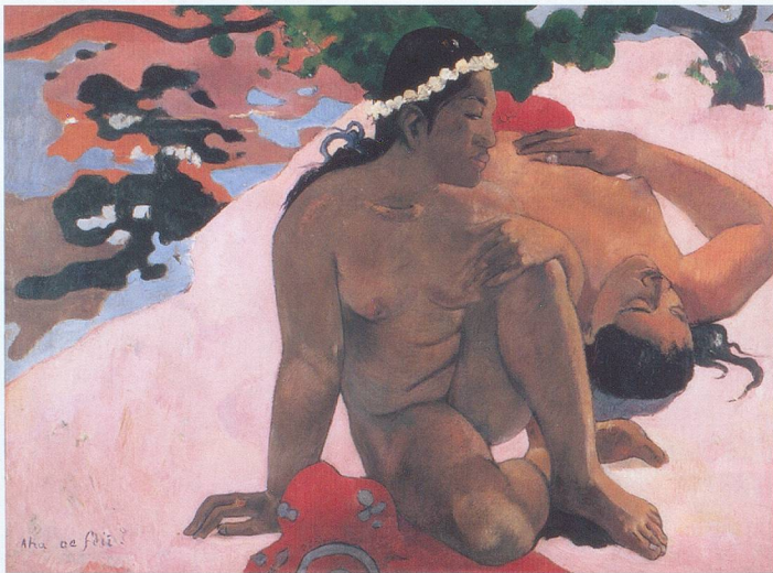
Les Vahinés de Tahiti, grandes inspiratrices de Paul Gauguin.

La Fondation Gianadda accueille les chefs-d'œuvre de la peinture française du Musée Pouchkine jusqu'au 13 novembre. Une exposition prestigieuse, qui réunit cinquante-quatre œuvres, de Poussin à Picasso.