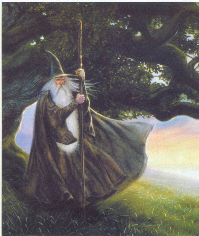
Sophisticated Games, Cambridge