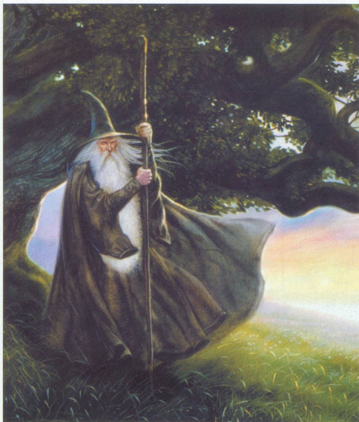
Sophisticated Games, Cambridge