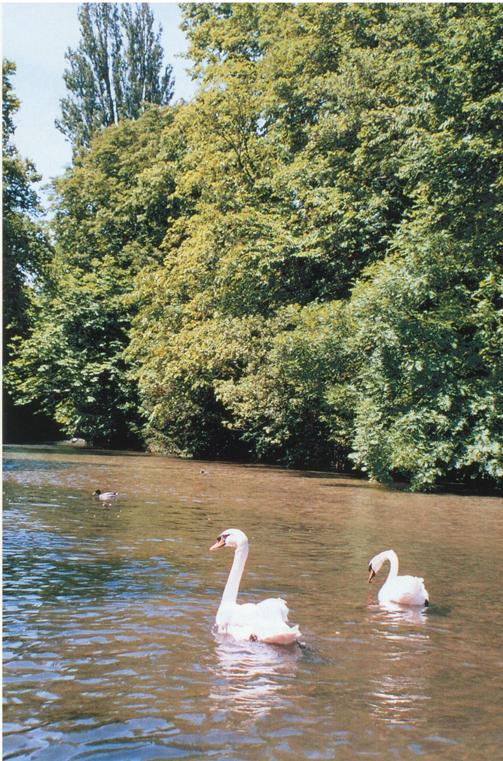
L'embouchure de la Versoix devant le Parc de la Bécassine.

Enfin, on accède au Parc de la Bécassine, un espace vert très agréable, accessible au public durant la journée. Il mène à l'embouchure de la Versoix, quelques dizaines de mètres plus loin. Ici, c'est le royaume des cygnes, des foulques et des colverts, qui ne sont dérangés ni par les voitures, ni par les promeneurs.