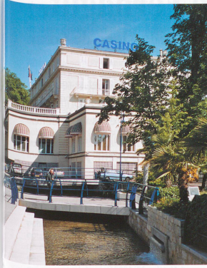
La Divonne canalisée au pied du casino.

Dès lors, la Versoix prend des allures moins farouches et moins sauvages. Elle coule doucement, sur quelques kilomètres, pour devenir «civilisée» aux abords de la commune de Sauvigny, qui est à cheval sur la frontière. Quelques couples de colverts barbotent joyeusement sous le pont, avant de se laisser glisser vers La Bâtie. Ce tronçon, abondamment ombragé, fait le bonheur des marcheurs, mais également des cavaliers, qui trouvent ici un cadre idéal