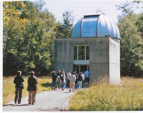
Des visiteurs pénètrent dans l'observatoire de Sauvigny.