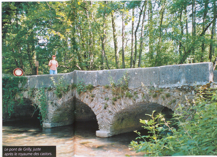
Le pont de Grilly, juste après le royaume des castors.

Plusieurs itinéraires pédestres transfrontaliers permettent de découvrir la Versoix après le tronçon sauvage et marécageux