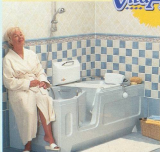
L'élévateur est adaptable sur votre baignoire existante

VitaActiva, le spécialiste pour le plaisir du bain dans l'insouciance