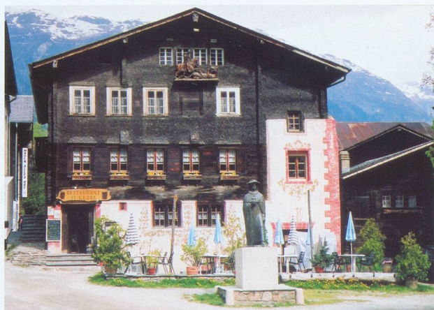
Un restaurant typique situé au cœur d'Ernen.

» Restaurant St-Georg, Ernen, tél. 027 971 11 28, fermé le mardi en juillet et août.