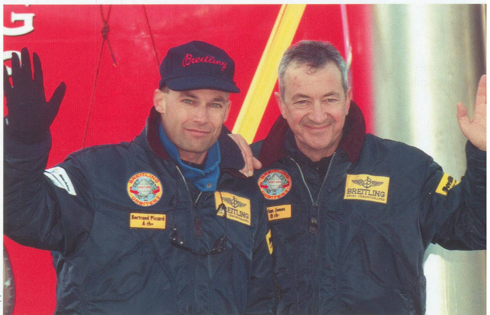
Bertrand Piccard et Brian Jones au terme de leur tour du monde en ballon sans escale.

– Il me convient, si cela me permet de promouvoir ma fondation humanitaire, de développer mon nouveau projet Solar Impulse ou de faire passer des messages qui me paraissent importants sur l'environnement ou la société. Quant au reste, c'est en fait à