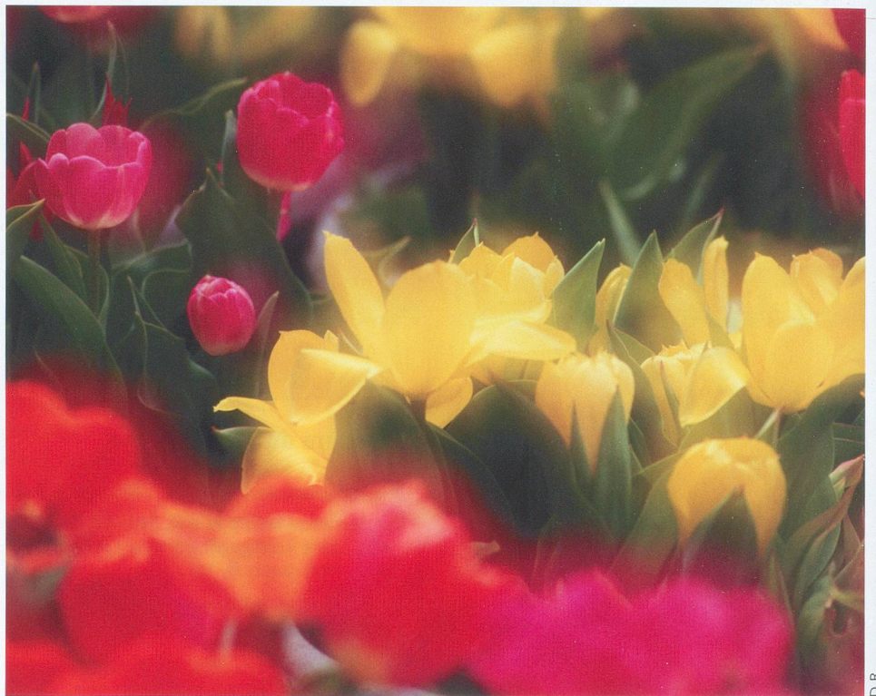
Au printemps, c'est une explosion de couleurs dans les jardins.

Les mois d'hiver ont paralysé la végétation et, si nous avons délaissé quelque temps notre jardin, nous avons l'impression de le retrouver tel que nous l'avons laissé à l'automne. Nous marchons parfois sur de petits monticules de terre. Ce sont