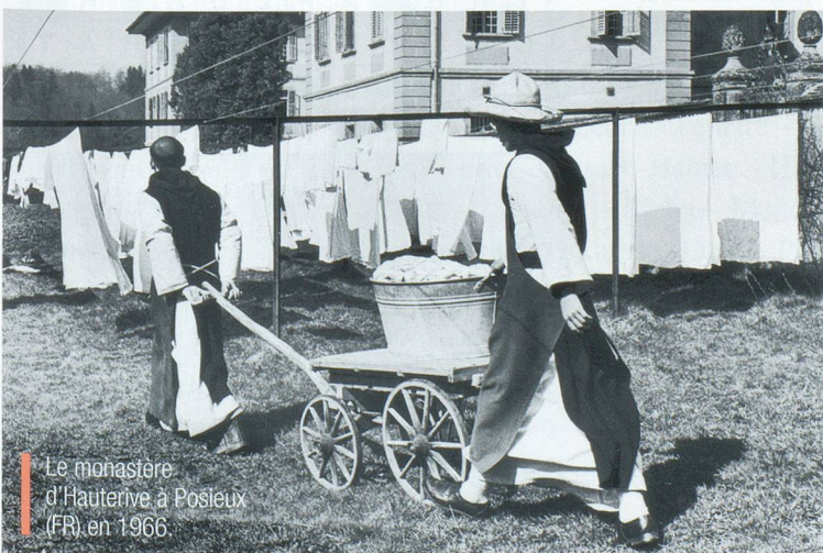
Le monastère d'Hauterive à Posieux (FR) en 1966.