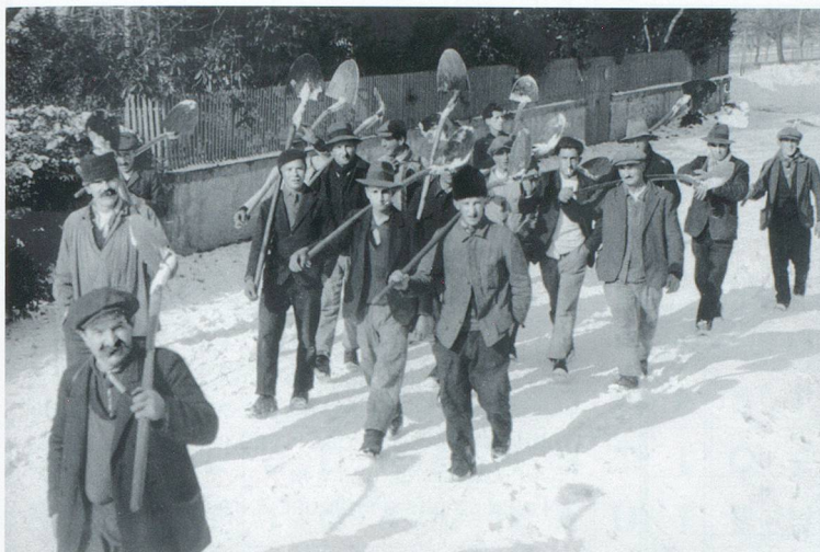
Les chômeurs déblaient la neige à Lausanne en 1935.