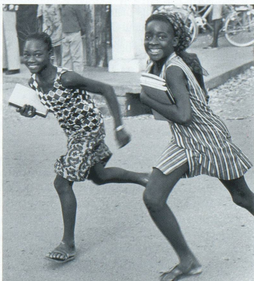
Deux fillettes dans les rues de Ouagadougou en 1973.