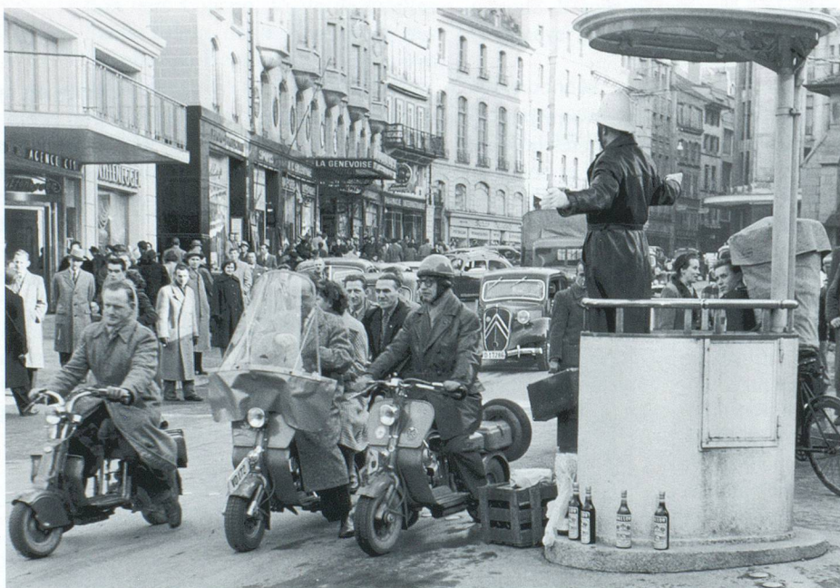
Lausanne, place Saint-François; les étrennes des policiers en 1953.