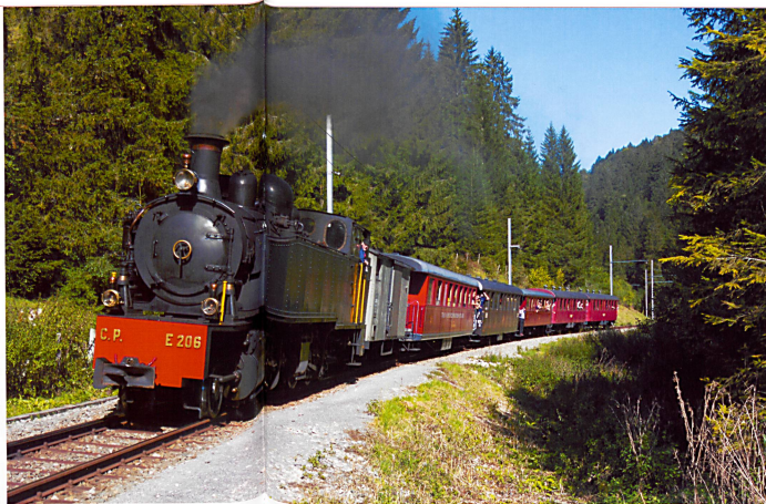
Nostalgie avec le Train à Vapeur des Franches-Montagnes.

jourd'hui encore 85 km de lignes, dont 74 à voie étroite. De 423 m d'altitude (Porrentruy) à 1073 m (Bellevue), les CJ sillonnent essentiellement le haut-plateau franc-montagnard. Leurs compositions rouges, portant une tête de cheval, sont partie intégrante de l'image de ce pays, où ils emploient près de 150 personnes. Au fil des décennies, la compagnie a