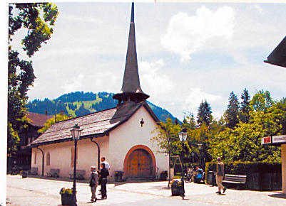
Eglise de Gstaad, départ de la promenade.

Renseignements: GoldenPass Services, Case postale 1426, 1820 Montreux 1, tél. 021 989 81 81 ou 0900 245 245, ou www.mob.ch ou www.goldenpass.ch .