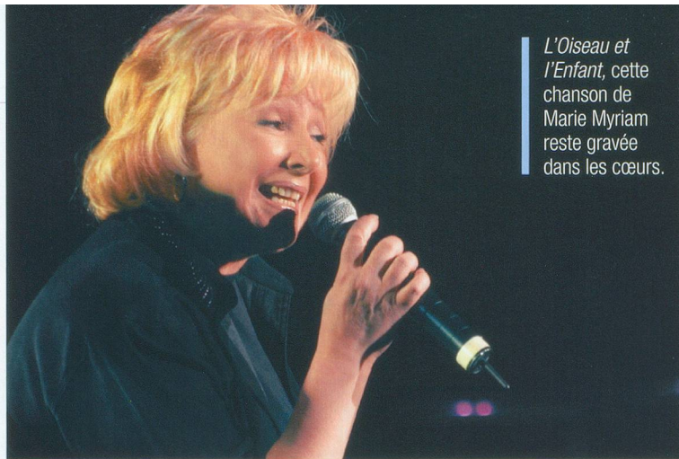
L'Oiseau et l'Enfant, cette chanson de Marie Myriam reste gravée dans les cœurs.

– Je crois que, quelle que soit l'époque de leurs débuts, certains chanteurs sauront durer. Un Bénabar par exemple, je suis certain qu'on l'entendra encore dans quarante ans. Cela dit, il est vrai que les années soixante représentent quelque chose de particulier. Les enfants de l'après-guerre avaient vingt ans. Pour eux, ce fut une forme de libération, tant intellectuelle que sexuelle. Ils ont dansé leur jeunesse sur des succès anglo-saxons adaptés en français, sur des chansons populaires. Ils ont vécu une période d'euphorie avant de