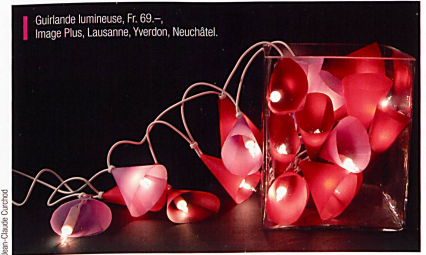
Guiflande lumineuse, Fr. 69.-, Image Plus, Lausanne, Yverdon, Neuchâtel.