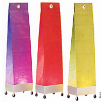
Marek, lampadaires en papier, divers coloris, Fr. 29.95, Ikea.