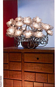
Rosamunda petite fleur (25 bras, env. Fr. 120.- à 150.- le bras, 5 couleurs disponibles), série limitée signée W. Bonanno. En exclusivité chez Espace Arts et Lumière, Sion.

Il faut se souvenir qu'elles ne sont que des sources lumineuses d'appoint. Pour lire ou travailler, un bon éclairage est nécessaire. Pour regarder la télévision, une lumière indirecte – car il ne faut pas qu'elle se reflète dans l'écran – est toujours recommandée. Et puis, quand on en a plus besoin... on éteint. ■