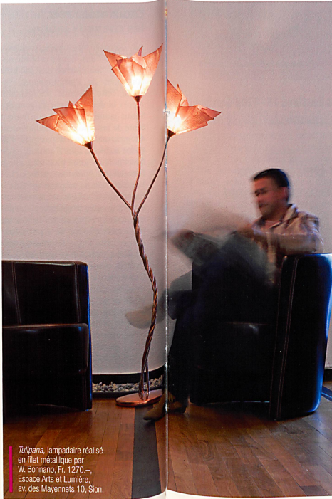
Tuliparia, lampadaire réalisé en filet métallique par W. Bonanno, Fr. 1270.-, Espace Arts et Lumière, av. des Mayennets 10, Sion.

La lampe est devenue objet de décoration, destinée à créer une ambiance particulière dans la pièce. Classiques ou design, kitsch ou ethno, en papier, en verre ou en métal, les luminaires se déclinent dans toutes les formes, toutes les couleurs et tous les styles. Il y en a pour tous les goûts et à tous les prix. L'idée étant que ces objets lumineux s'harmonisent avec le mobilier, soit pour créer une rupture dans un intérieur classique ou au contraire amener une once de classicisme dans un décor moderne. On ne leur demande pas de faire de la lu-