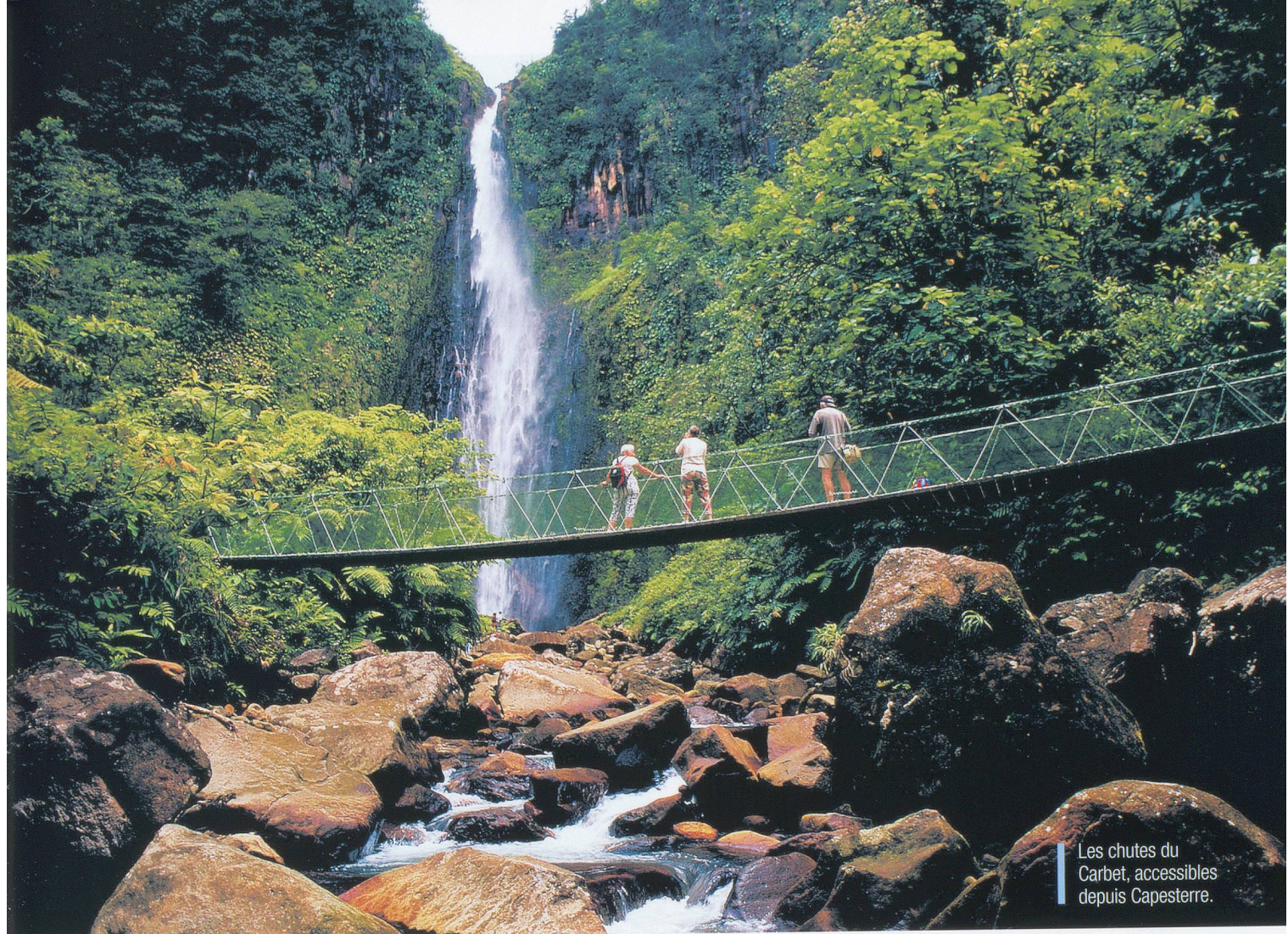
Les chutes du Carbet, accessibles depuis Capesterre.