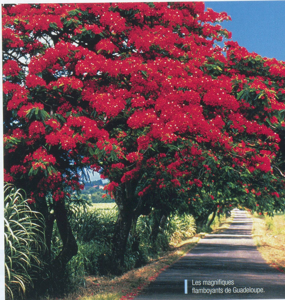
Les magnifiques flamboyants de Guadeloupe.

Proposition de voyages: Antilles Evasions Voyages, 3, rue Roi-Victor-Amé, 1227 Carouge. Tél. 022 820 32 47. www.antilles.ch