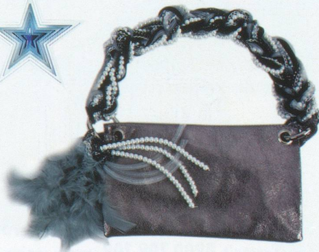
Pochette en peau laquée poignée en perles, se porte aussi en bandoulière. Création Kontessa, Fr. 139.- chez Banfi, Pully.

Adresses: A Propos , Langallerie 4, Lausanne, tél. 021 312 87 04. Hohlstr. 201, Zurich, tél. 044 242 36 56. Rosael , rue de la Louve 3, Lausanne, tél. 078 882 50 11. Cité 19 , adresse identique, tél. 022 310 56 46. Rouge de Honte , rue Caroline 5, Lausanne, tél. 021 312 85 15. On Stage , rue Saint Victor 11, Carouge, tél. 022 343 02 93. Enthésis , rue des Fosses 10, Morges, tél. 021 801 52 97. Accessoirement , rue Marterey 7, Lausanne, tél. 021 311 90 74. Lorette , rue de Bourg 11, Lausanne, tél. 021 323 53 71. Cours de Rive 13, Genève, tél. 022 735 83 30. Globus , Genève, Lausanne, Neuchâtel. Swarovski , rue de Bourg 10, Lausanne, tél. 021 351 50 55. Rue du Marché 7 Genève, tél. 022 310 88 11. Banfi , Grand-Rue 10, Pully, tél. 021 711 23 09.