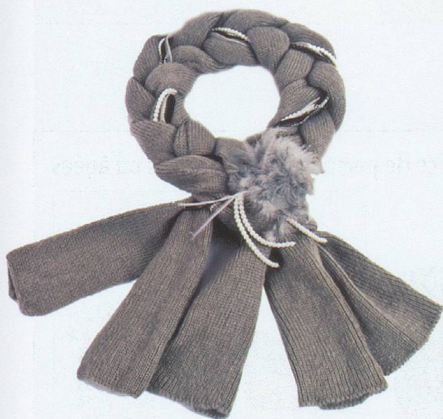
Une longue tresse douillette ornée de perles, à porter en écharpe. Fr. 139.- Kontessa, chez Banfi, Pully.