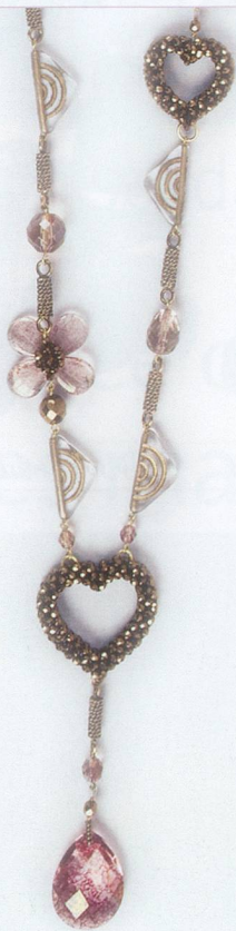
Sautoir perles métallisées et cristaux. Fr. 330.- Cité 19, Genève