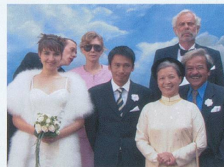
Mon frère se marie, film de Jean-Stéphane Bron.

CINÉMA DES AÎNÉS – Mon frère se marie , de Jean-Stéphane Bron (2006), avec J.-L. Bideau et Aurore Clément, lundi 3 septembre. L'Armée des Ombres , de J.-P. Melville (1969), avec Lino Ventura, Simone Signoret et J.-P. Cassel, lundi 17 septembre. Molière , de Laurent Tirard (2006) avec Romain Duris, Fabrice Luchini, Laura Morante, lundi 24