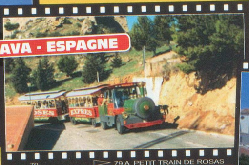
79 A PETIT TRAIN DE ROSAS