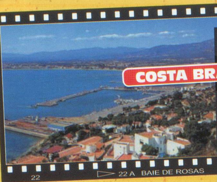
COSTA BRAVA - ESPAGNE