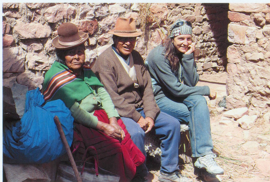
La marcheuse s'est liée d'amitié avec les Indiens des Andes.

– Par rapport aux femmes de votre génération, pensez-vous avoir quelque chose de différent?