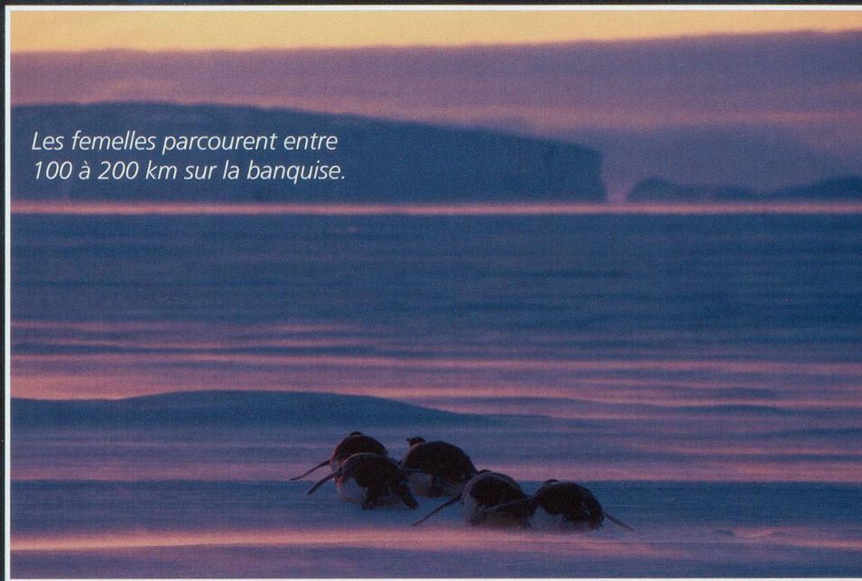
Les femelles parcourent entre 100 à 200 km sur la banquise.