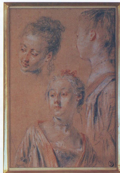
Antoine Watteau (1684-1721). Trois Etudes de Têtes féminines.

places disponibles. Les entretiens du mercredi à 12 h 30, les 7 et 21 février sont également gratuits et permettent d'entendre des spécialistes parler du dessin.