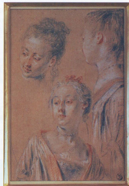
Antoine Watteau (1684-1721). Trois Etudes de Têtes féminines.

places disponibles. Les entretiens du mercredi à 12 h 30, les 7 et 21 février sont également gratuits et permettent d'entendre des spécialistes parler du dessin.