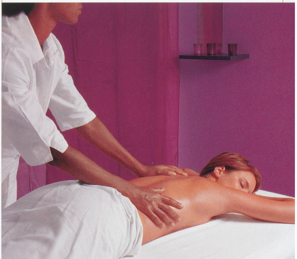
After the Rain

Wellness. Terme anglais pour faire référence à tout ce qui a trait au bien-être. Les centres qui pratiquent le wellness ressemblent aux spas, en un peu moins chic souvent et avec une offre moins étendue.