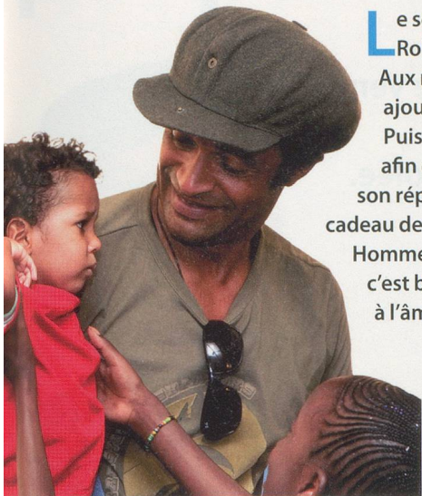
Séverine Rouiller / clind'oeil

L e seul chanteur français à avoir remporté Roland-Garros nous étonnera toujours. Aux rythmes africains et au reggae, il a ajouté les mélopées des Indiens du Chili. Puis il a marié guitares d'ici et de là-bas, afin d'insuffler une touche nouvelle à son répertoire. Fidèle à ses habitudes, il fait cadeau de son nouveau spectacle à Terre des Hommes. Ça s'appelle Charango , ça balance, c'est beau, c'est généreux et ça fait du bien à l'âme.